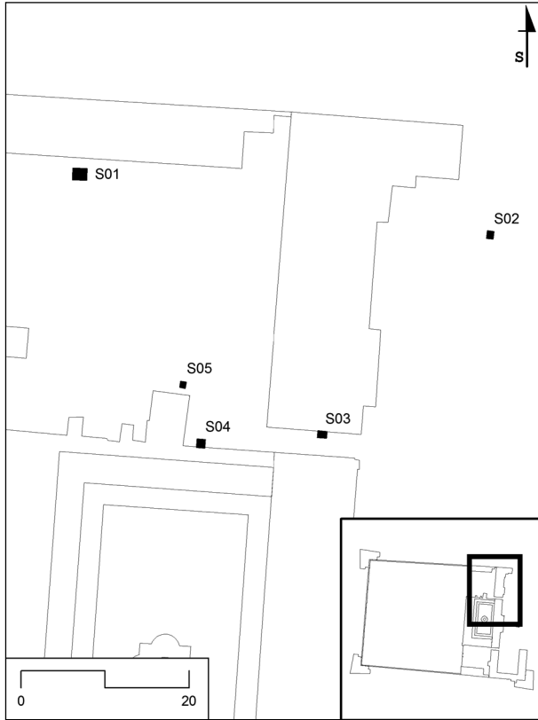
Obr. 15. Bučovice, lokalizace sond v rámci areálu zámku.

Bučovice (Bez. Vyškov), Zámek č. p. 1. Mittelalter, Neuzeit. Kirche, Schloss. Rettungsgrabung.