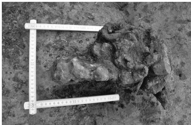
Obr. 2. Kobylnice – „Rybníky“, okr. Brno-venkov. Železný depot z doby římské.

Kobylnice (Bez. Brno-venkov), „Rybníky“. Römi-sche Kaiserzeit. Siedlung. Rettungsgrabung.