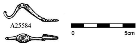
Obr. 6. Hulín – Záhlinice - „Skopalíkovo“. Zdobená laténská spona.

Abb. 6. Hulín – Záhlinice - „Skopalíkovo“. Verzierte Latènezeitliche fibeln.