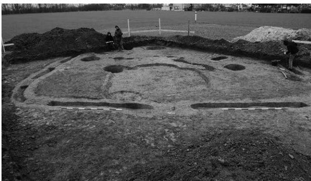
Obr. 5. Hulín – Záhlinice - „Skopalíkovo“. Pohled na plochu výzkumu.

Abb. 4. Hulín – Záhlinice - „Skopalíkovo“. Der Gesamtplan der Forschung (mit markierte Hütte aus der Römische Kaiserzeit).