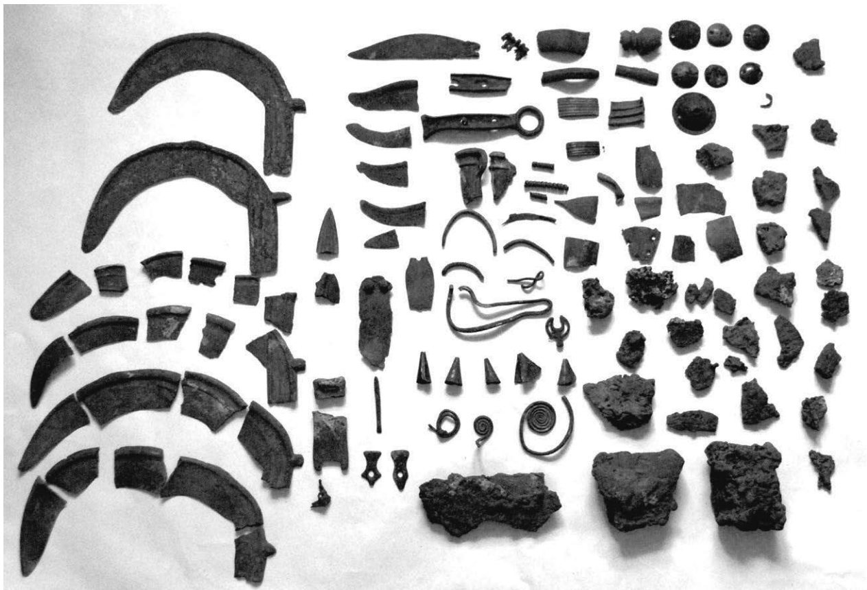
Obr. 20. Velké Bílovice – „Pod předními“. Depot bronzových artefaktů a slitků mědi.

Velké Němčice (Bez. Brno-venkov), „Podsedky“. Ältere Bronzezeit – Aunjetitzer Kultur. Siedlung. Rettungsgrabung.