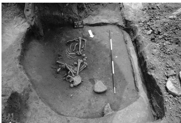
Obr. 17. Slatinky, „Močilky“. Pozůstatky lidského skeletu.

Slatinky (Bez. Prostějov), „Močilky“, Parz. Nr. 224/2. Ältere Bronzezeit. Bestattung in Siedlungsgrube. Rettungsgrabung.