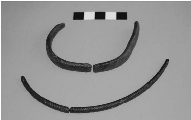
Obr. 14. Přerov – Lýsky, „Nad struhou“. Bronzové artefakty.