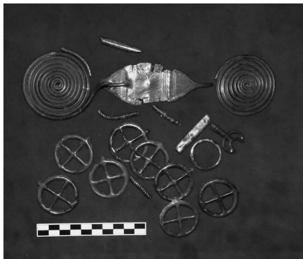
Obr. 2. Borotín. Depot z mladší doby bronzové.

Borotín (Bez. Blansko), „V Občinách“. Jüngere Bronzezeit. Depot. Rettungsgrabung.