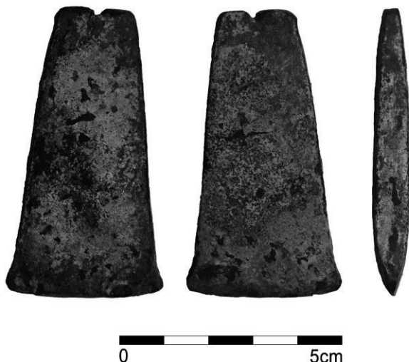
Obr. 17. Přerov – Předmostí. Měděná sekera.

Svatopluk Bříza, Lubomír Šebela, Petr Úlahel