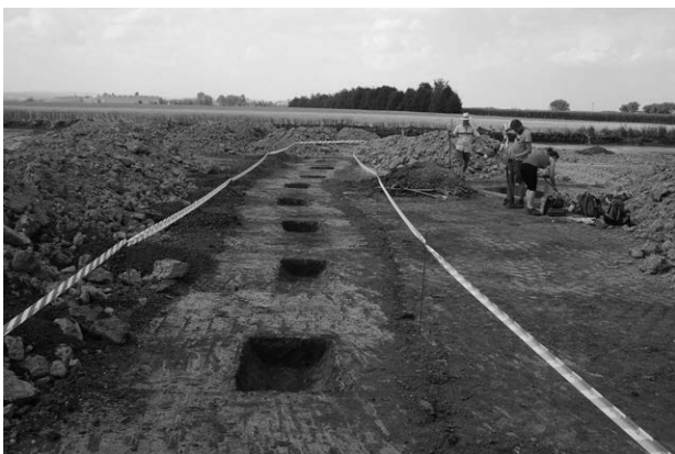
Obr. 13. Olšany u Prostějova. Pohled na výzkumem zachycený úsek ohrazení. Abb. 13. Olšany u Prostějova. Blick auf den entdeckten Abschnitt der Einzäunung