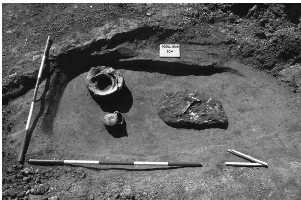
Obr. 14. Podolí. Žárový hrob KZP. Abb. 14. Podolí. Brandgrab der Glockenbecherkultur.

Podolí (Kat. Podolí u Brna, Bez. Brno-venkov), „Nad cihelnou“. Glockenbecherkultur. Gräberfeld. Rettungsgrabung.