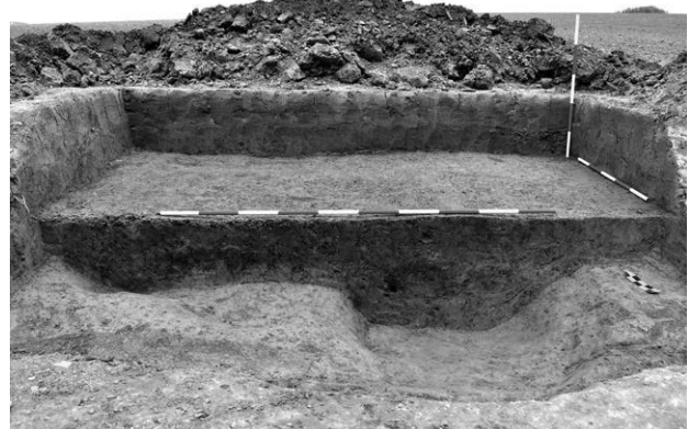
Obr. 15. Vážany – „Padělky u Divoků“. Pohled na zkoumaný objekt.

Archeologický dohled a následný záchranný archeologický výzkum prokázal na místě zasaženém rekonstrukcí polní cesty zcela novou archeologickou lokalitu, v rámci níž byl blíže prozkoumán jeden zahloubený objekt (obr. 15). Po interpretační stránce se jedná buďto o hliník na těžbu keramické matrix či jinou funkčně blíže neurčitelnou sídlištní jámu. Na zá-