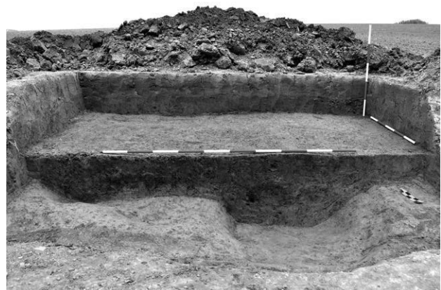
Obr. 15. Vážany – „Padělky u Divoků“. Pohled na zkoumaný objekt.

Archeologický dohled a následný záchranný archeologický výzkum prokázal na místě zasaženém rekonstrukcí polní cesty zcela novou archeologickou lokalitu, v rámci níž byl blíže prozkoumán jeden zahloubený objekt (obr. 15). Po interpretační stránce se jedná buďto o hliník na těžbu keramické matrix či jinou funkčně blíže neurčitelnou sídlištní jámu. Na zá-