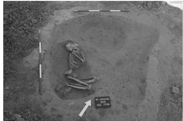
Obr. 1. Brno (k. ú. Starý Lískovec, okr. Brno-město). Dětský pohřeb v sídlištní jámě.

wurde die südliche Grenze der bekannten Siedlung der Kultur mit der Linienbandkeramik entdeckt. In einer Grube wurde die Kinderbestattung gefunden.