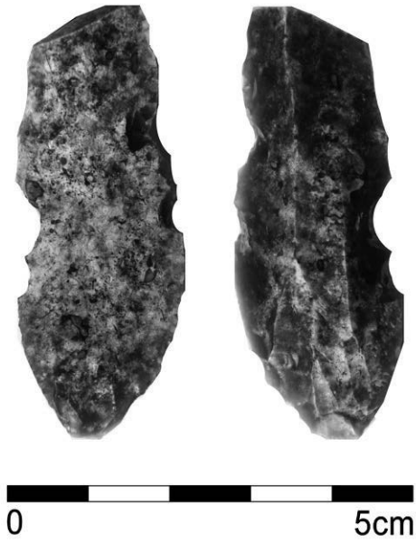
Obr. 8. Turovice. Rydlo na čepeli. Abb. 8. Turovice Burin on blade.