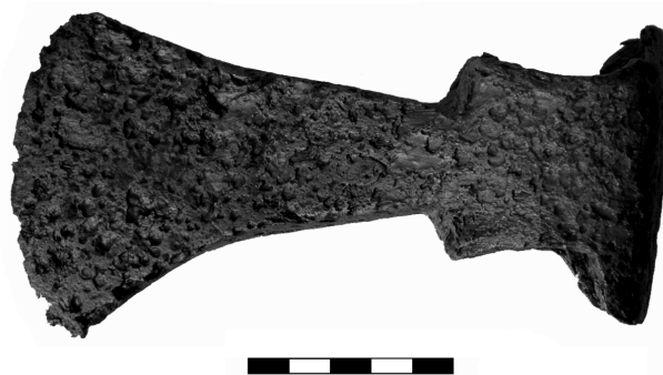
Obr. 73. Vysoké Popovice (okr. Brno-venkov). Ojedinelý nále železných sekerky z období raného středověku.

Zdeněk Hájek, Jaroslav Dytrych, Petr Žákovský, Adéla Balcárková