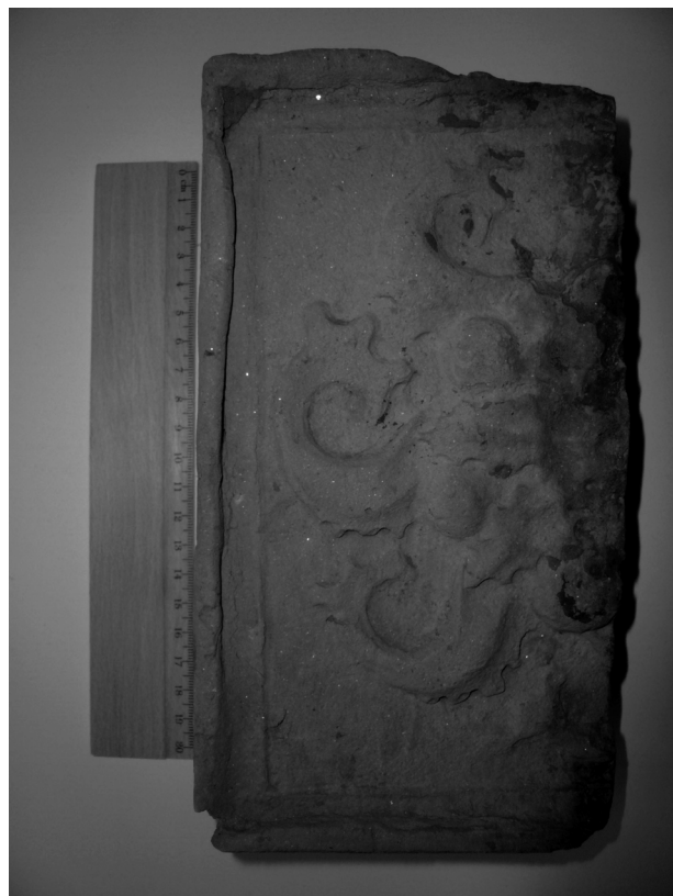
Abb. 70. Velké Losiny, das Schloss. Die neuzeitliche Ofenkachel mit der Rosette. Foto J. Doupal.

Obr. 71. Velké Losiny, zámek. Komorový kachel s motivem rozety. Foto J. Doupal.