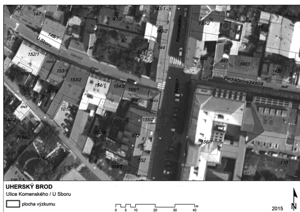
Obr. 67. Uherský Brod – ulice Komenského, U Sboru. Lokalizace zkoumané parcely.

Uherský Brod (Uherské Hradiště District), Komenského Street, U Sboru Street. Middle age, Modern times. Town. Rescue excavation.