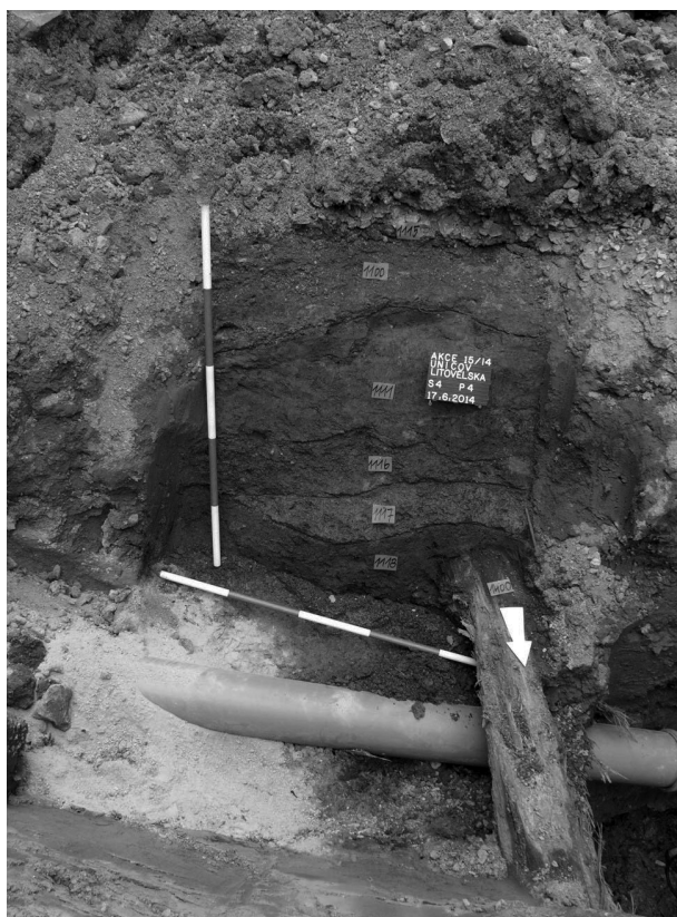
Obr. 68. Uničov, Litovelská ulice, před č. p. 192. Příčný profil dokumentující nárůst uličních vrstev a konstrukci komunikace (profil P4).

Záchranný archeologický výzkum vyvolaný rekonstrukcí komunikací a inženýrských sítí v jižní části historického jádra Uničova (ul. Haškova, Příční a Litovelská) provádělo od června do října 2014 v souběhu s výkopovými pracemi olomoucké pracoviště Národního památkového ústavu. V ulici Haškově byly vyhloubeny tři předstihové archeologické sondy v místech projektované výsadby stromů. Sondy obnažily částečně zasypané sklepy v někdejší zahradě minoritského kláštera a kulturní souvrství tvořící se od doby lokace města. Historický terén ulice Příční byl v minulosti značně porušen, dokumentována zde byla novověká stoka. V Litovelské ulici přinesl výzkum nové poznatky k vývoji konstrukce komunikací již od vrcholného středověku – zjištěny byly obrubníky ve formě podélně položených klád, fixovaných kameny, prkna, vysypávky drobnými kameny a struskou (obr. 68, 69). Před č. p. 185 a 177 výzkum