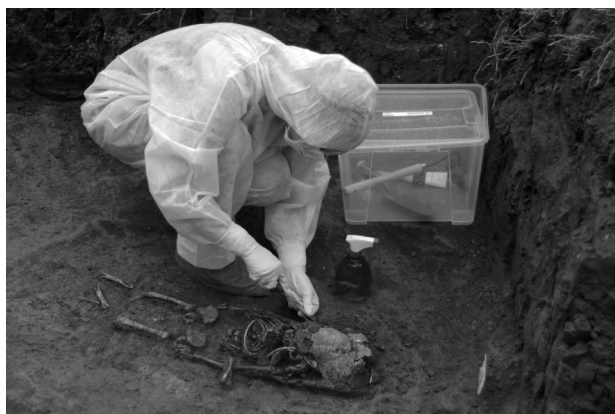
Obr. 59. Olšany u Prostějova, „Zlatniska“. Sterilní odběr vzorků vhodných k podrobnějšímu genetickému zkoumání.

Abb. 58. Olšany u Prostějova, „Zlatniska“. Der jungburgwallzeitliche Schmuckkollektion aus dem Grab Nr. 6/2015.