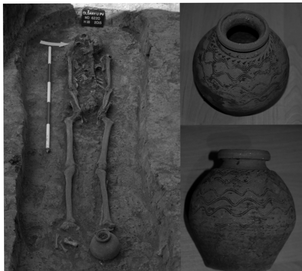
Obr. 57. Olšany u Prostějova, „Zlatniska“. Hrob č. 18/2015 a keramická láhev uložená v nohách nebožtíka. Abb. 57. Olšany u Prostějova, „Zlatniska“. Grab Nr. 18/2015 und bei den Füßen des Gestorbenes angelegte keramische Flasche.

Olšany u Prostějova (Bez. Prostějov), „Zlatniska“. Jüngere Burgwallzeit. Gräberfeld. Rettungsgrabung.