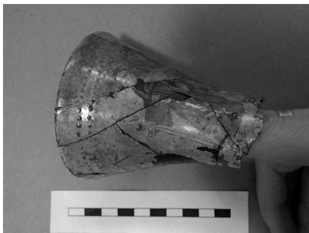
Obr. 55. Olomouc, Sokolská ulice. Kalichovitě rozevřený pohár.

Abb. 55. Olomouc, Sokolská Straße. Die Becher mit einem Kelchrand.