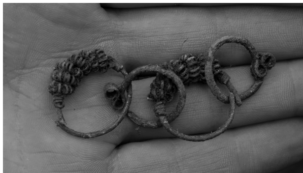
Obr. 58. Olšany u Prostějova, „Zlatniska“. Kolekce šperků z mladohradištního hrobu č. 6/2015.

Abb. 58. Olšany u Prostějova, „Zlatniska“. Der jungburgwallzeitliche Schmuckkollektion aus dem Grab Nr. 6/2015.