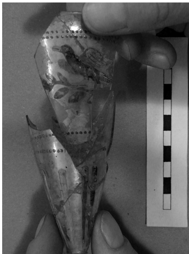
Obr. 54. Olomouc, Sokolská ulice. Vřetenovitý pohár.

Abb. 53. Olomouc, Sokolská Straße. Der Kloakenboden.