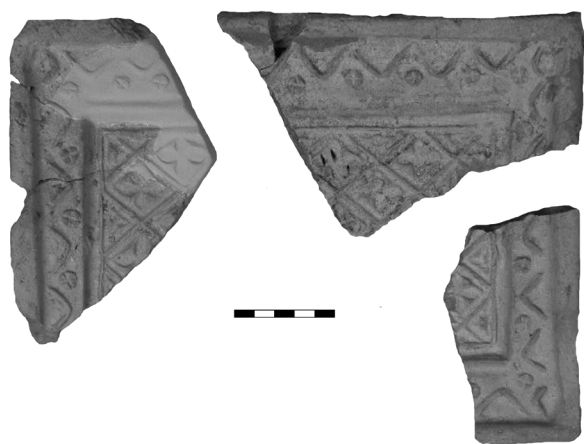
Obr. 37. Neslovice (okr. Brno-venkov). Fragment kachle. Fig. 37. Neslovice (Brno-venkov District). Fragment of stove tile.

stratigrafie; poslední objekt spadá až do 18. století. Většinu získaného materiálu tvořila keramika (obr. 36), dále se objevila mazanice, zvířecí kosti, zlomky želez a skel. Mezi ojedinělé nálezy ve vesnickém prostředí patří nález kachle (obr. 37; Hájek a kolektiv 2015, 126).