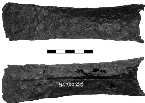
Obr. 34. Neslovice (okr. Brno-venkov). Železná teslice. Fig. 34. Neslovice (Brno-venkov District). Iron stone.