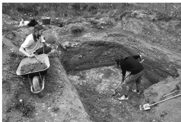
Obr. 28. Hostěnice. Výzkum vápenického milíře. Abb. 28. Hostěnice. Forschung über Kalkhaufen.

Hostěnice (Bez. Brno-venkov), gebauter Teil der Gemeinde, Parz. Nr. 274/16. Neuzeit. Kalkhaufen. Rettungsgabung.