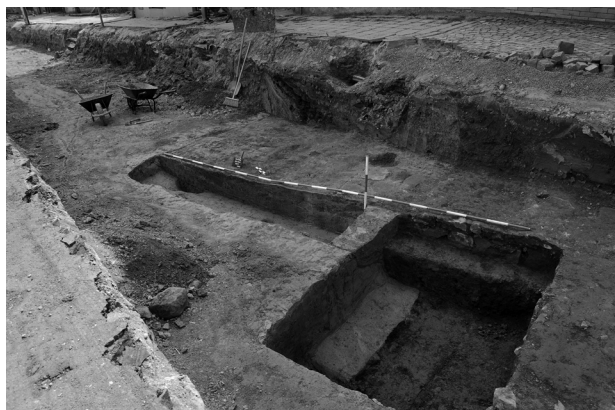
Obr. 26. Fryšták, ulice 6. května. Pohled od severu na zkoumanou plochu.

Fryšták (Bez. Zlín), 6. května Straße. Spätmittelalter, Neuzeit. Stadt, Kommunikation (Faschinen Weg). Rettungsgrabung.