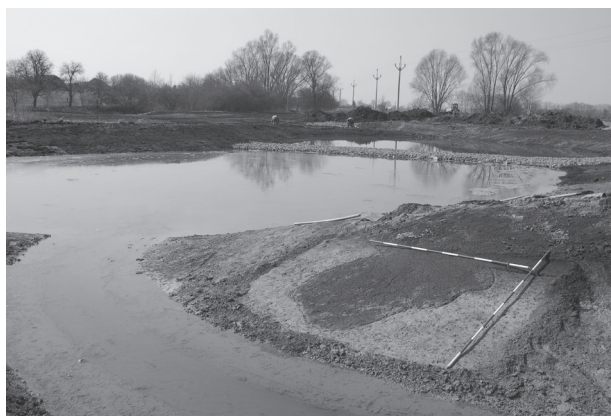
Obr. 4. Prostějov – Čehovice, „Loučky před drahou“. Pohled na zkoumanou plochu.

Prostějov (Kat. Čehovice u Prostějova, Bez. Prostějov), „Loučky před drahou“. Hallstattzeit und Latènezeit. Siedlung. Rettungsgrabung.