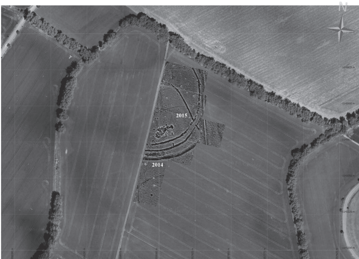
Obr. 29. Vřesovice, okr. Prostějov, „Vřesovská“. Výsledky geofyzikálních měření lokality s vyznačením dosud uskutečněných terénních odkrytí.