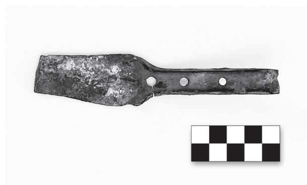
Obr. 15. Náměšť na Hané. Bronzová dýka typu Peschiera. Abb. 15. Náměšť na Hané. Der Bronzedolch des Peschiera-Typus.

Náměšť na Hané (Bez. Olomouc), „V Psínku“. Lusatizer Urnenfelderkultur. Einzelfund. Oberflächensammlung.