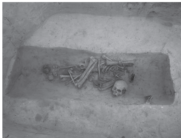
Obr. 13. Modřice. Únětický hrob. Fig. 13. Modřice. Ein Aunjetitzer Grab.

Modřice (Bez. Brno-venkov), „Rybníky“, U Vlečky-Straße. Aunjetitzer Kultur. Gräberfeld. Rettungsgrabung.