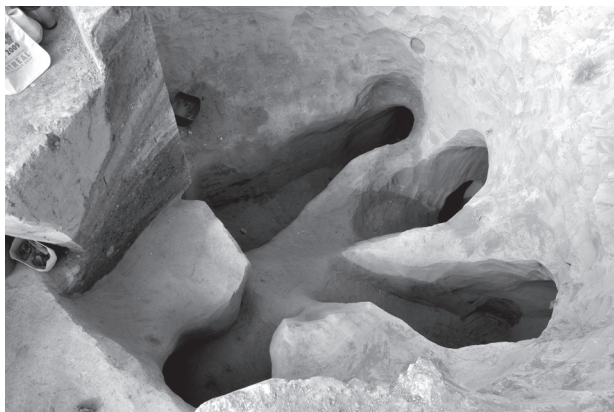
Obr. 12. Modřice-Rybníky. Podzemní chodby. Abb. 12. Modřice-Rybníky. Unterirdische Gängen.