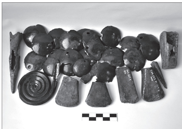
Obr. 3. Horní Němčí. Depot bronzových předmětů.

Horní Němčí (Uherské Hradiště Dist.), „Horní kopec“. Bronze age. Depot. Isolated artefacts.