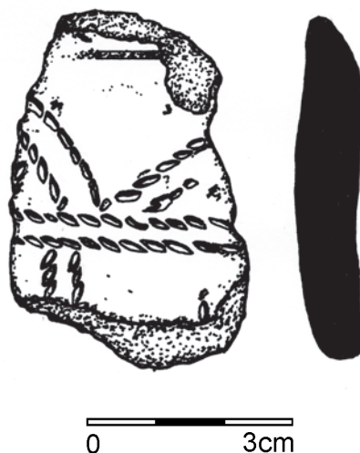
Obr. 22. Těšetice. Keramický fragment KKA (kresba R. Přehnalová).

Abb. 22. Těšetice, Bez. Olomouc. Bruchstück der Keramik der Kugelamphorenkultur (Zeichnung R. Přehnalová).