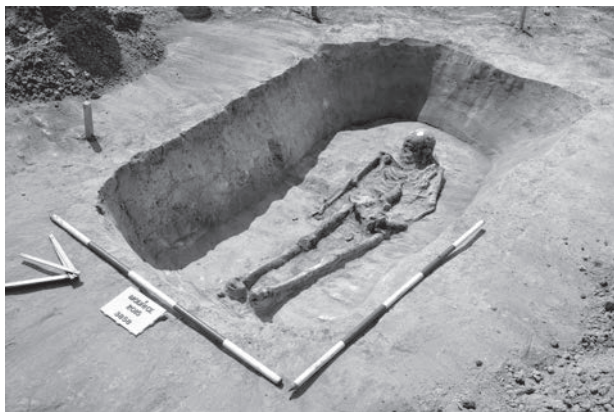
Obr. 13. Modřice. Kostrový hrob z období eneolitu.

Modřice (Bez. Brno-venkov), „Rybníky“. Jordanów Kultur, Trichterbecherkultur, Badener Kultur/Kultur mit kannelierter Keramik, Jevišovice-Kultur, Glockenbecherkultur, Proto-Aunjetitz Kultur. Siedlung, Gräberfeld. Rettungsgrabung.