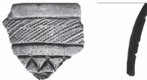
Obr. 12. Měrovice nad Hanou. Zlomek okraje zdobeného zvoncovitého poháru.

Měrovice nad Hanou (Bez. Přerov), „Před hřbitovem“. Glockenbecherkultur. Einzelfund. Oberflächensammlung.