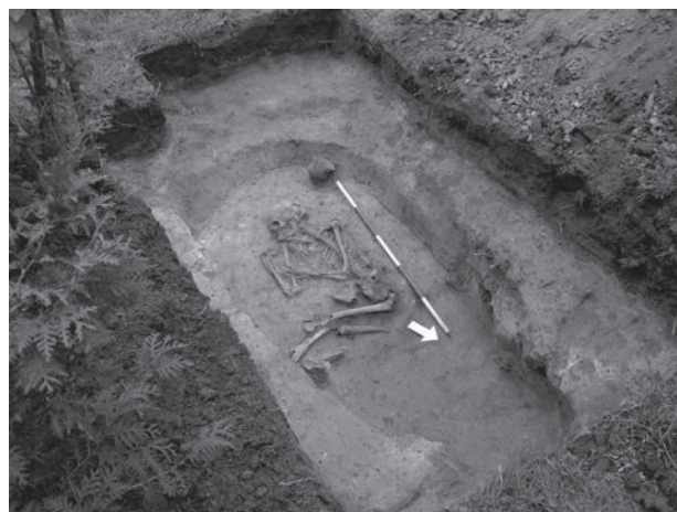
Obr. 10. Ivančice (k. ú. Budkovice). Hrob kultury se zvoncovitými poháry.

Abb. 10. Ivančice (Kat. Budkovice). Grab der Glockenbecherkultur.