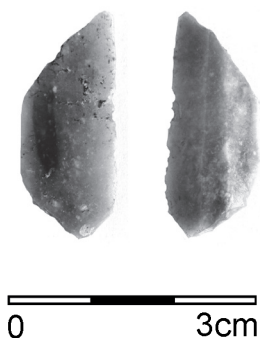
Obr. 12. Přerov (okr. Přerov), ulice Šířava. Čepel s příčnou retuší a leskem.

Přerov (Přerov Dist.), Šířava Street. During a salvage archaeological excavation on Šířava Street in Přerov in 2015, an isolated Neolithic artefact was documented. A truncated blade with the characteristic sickle gloss was made of erratic flint.