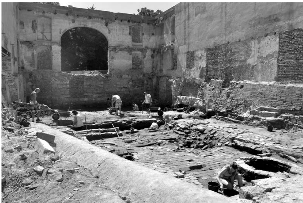
Obr. 79. Valtice – zámek. Výzkum lichtenštejnského divadla.

Abb. 79. Valtice – Schloss. Forschung des Liechtenstein-Theatres.