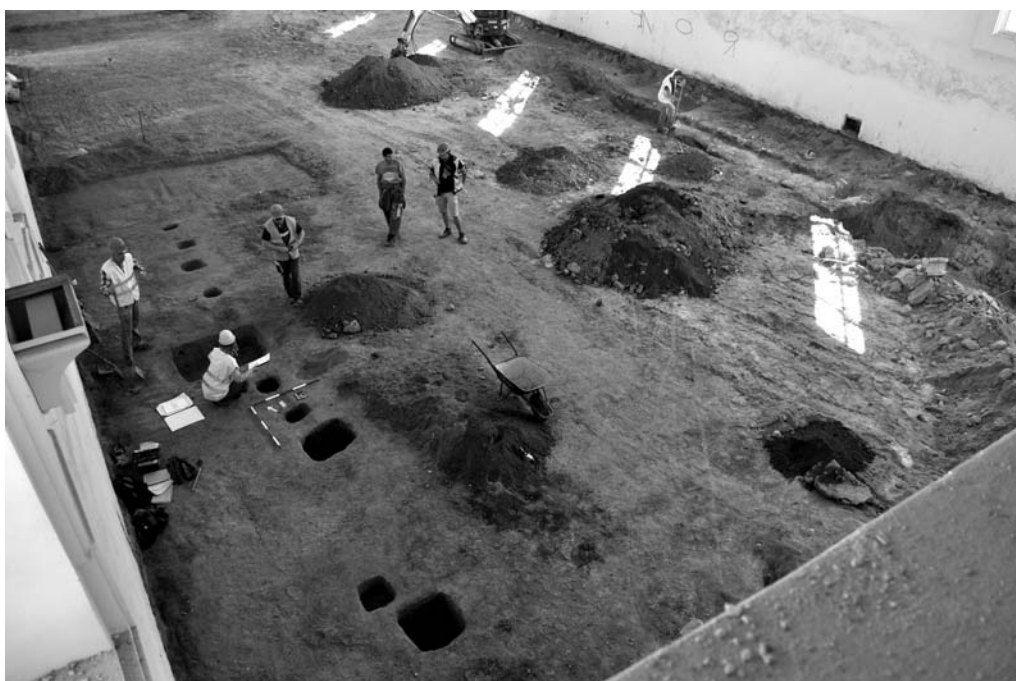
Obr. 80. Valtice – zámek. Výzkum jízdárny.

Záchraný archeologický výzkum, realizovaný společností Archaia Olomouc, o. p. s., probíhal v rámci stavby „Muzeum regionu Valašska, p. o. - Stavební úpravy zámku Vsetín - 1. etapa“. Archeologicky byla prozkoumána plocha dvora, prvního patra, sklepních a půdních