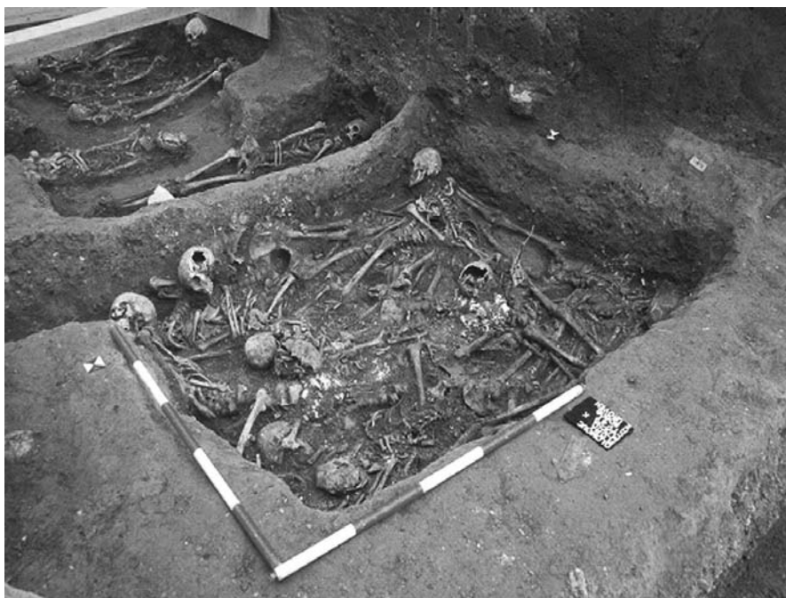
Obr. 67. Olomouc – Flora. Hromadné hroby odkryté v severovýchodní části zkoumané plochy.

Abb. 67. Olomouc – Flora. Massengraben entdeckt im nordöstlichen Teil der Grabungsfläche.