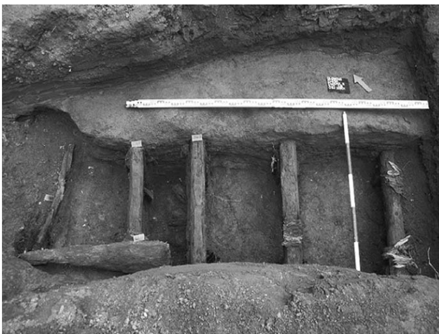
Obr. 68. Olomouc – Flora. Část výkopu, pruské sapy zachycené během výzkumu.

jež byla vedena na hlavní řad vedený ulicí Zamenhofova (obr. 66). Skrytá plocha přibližně obdélného tvaru dosahovala rozměrů 25×60 m. Kanalizace, jejíž podstatná část byla vedena středem parkoviště, vyústovala v západní části skryté plochy a dále pokračovala v rozsahu 4×12 m do Zamenhofovy ulice. Během výzkumu bylo zachyceno 320 hrobových jam, v nichž bylo pohřbeno celkem 418 jedinců. Podstatnou část zachycených hrobů lze přiřadit k období rozrůstajícího se civilního katolického hřbitova, jehož součástí se také stal nevyužívaný vojenský hřbitov (Hadrava, Kováčik, Šlězár, 2013, 124–125). To nám také potvrdila nálezová situace, kdy většina zachycených hromadných hrobů typických pro vojenský hřbitov byla porušena mladšími civilními hroby. Odkrytá plocha zřejmě představuje nejmladší část hřbitova „U Dřevěného zvo-