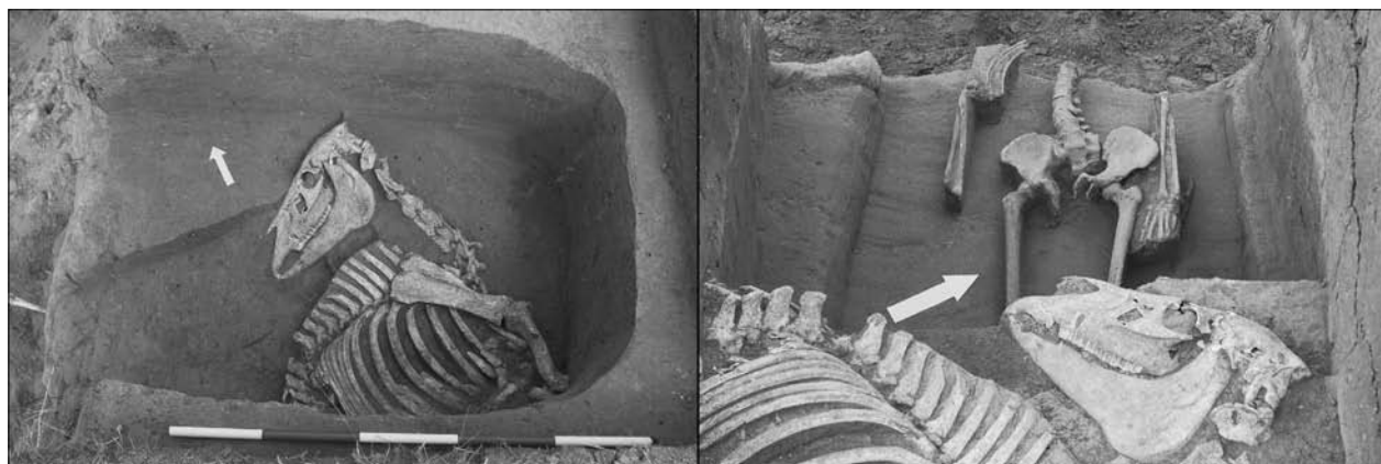
Obr. 29. Držovice na Moravě, okr. Prostějov. Hliník bývalé cihelny. Raně středověký pohřeb koně a jezdce – lukostřelce.