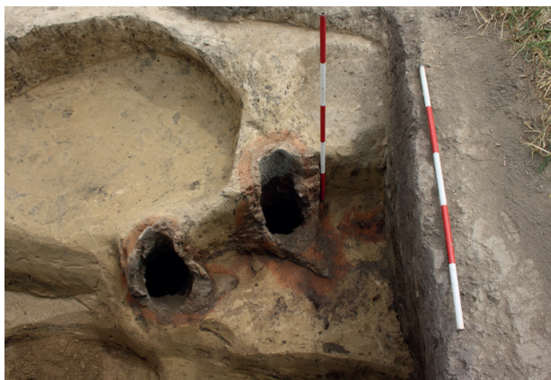
Obr. 10. Žarošice (okr. Hodonín). Pohled na prozkoumané železářské pece.