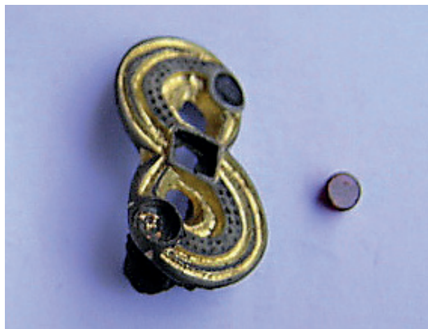
Obr. 8. Vranovice. Esovitá spona. Fig. 8. Vranovice. S-shaped brooch.