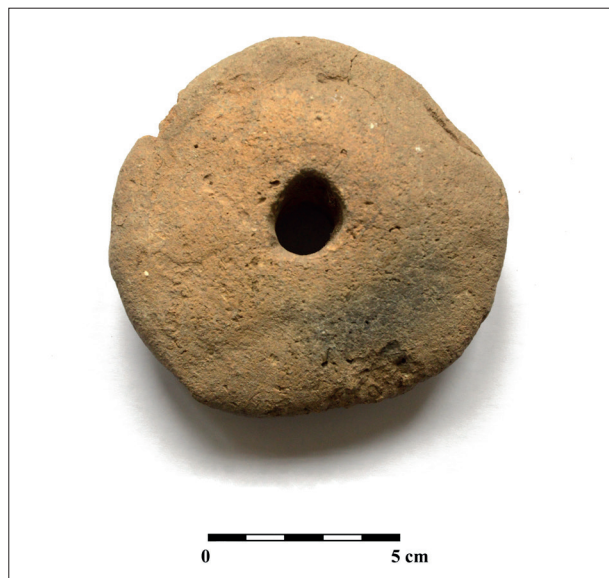
Obr. 4. Mikulov, „U aleje“. Keramické závaží. Abb. 4. Mikulov, „U aleje“. Keramisches Gewicht.

Mikulov (Bez. Břeclav), „U vodárny“. Römische Kaiserzeit. Siedlung. Rettungsgrabung.