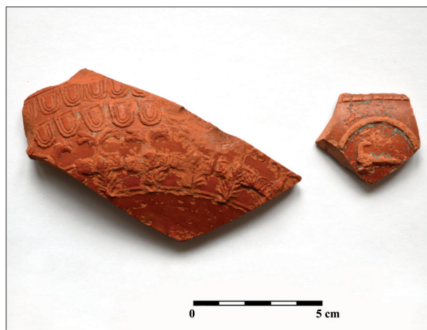
Obr. 5. Mikulov, „U vodárny“. Fragmentsy z nádob typu terra sigillata. Abb. 5. Mikulov, „U vodárny“. Fragmente von Terra Sigillata-Gefässe.