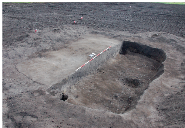
Obr. 3. Měnin. Zahloubená chata z doby římské.

Měnin (Bez. Brno-venkov), „Rybárna“. Römische Kaiserzeit. Siedlung. Rettungsgrabung.