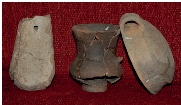
Obr. 17. Prostějov-Krasice. Výběr keramiky (mohylová kultura).

Prostějov-Krasice (Bez. Prostějov), „Višnovce“. Mittlere Bronzezeit – Mitteldonauländische Hügelgräberkultur, Jüngere Bronzezeit und Spätbronzezeit – Lausitzer Urnenfelderkultur. Siedlung. Rettungsgrabung.