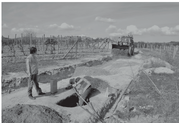
Obr. 9. Mikulov. Výzkum objektů únětického sídliště. Abb. 9. Mikulov. Die Forschung der Aunjetitzer Siedlung.