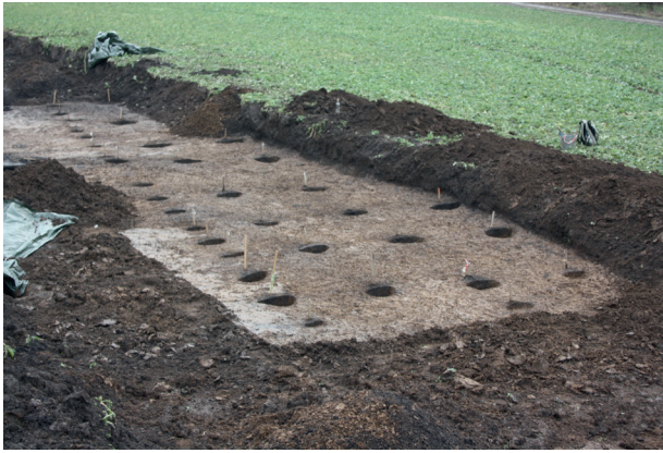
Obr. 4. Boskovice (okr. Blansko), „Pod Lipníky“. Pohled na prozkoumaný půdorys neolitického domu. Fig. 4. Boskovice (Blansko District), „Pod Lipníky“. The excavated ground plan of a Neolithic house.