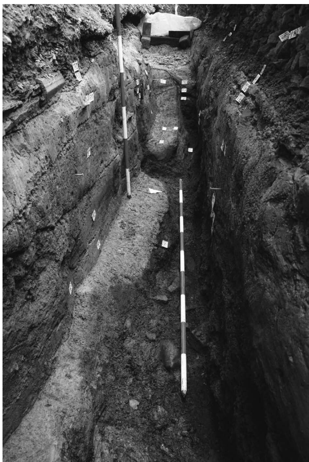
Obr. 88. Opava - Beethovenova ulice. Sonda S1. Celkový pohled na suterén dřevohliněné nadzemní stavby sloupové konstrukce. Foto František Kolář.

Abb. 88. Opava, Beethovenova-Straße. Grabungsschnitt S1. Gesamtblick auf Untergeschoss des oberirdischen Pfosten-Holzerdebaues. Foto František Kolář.