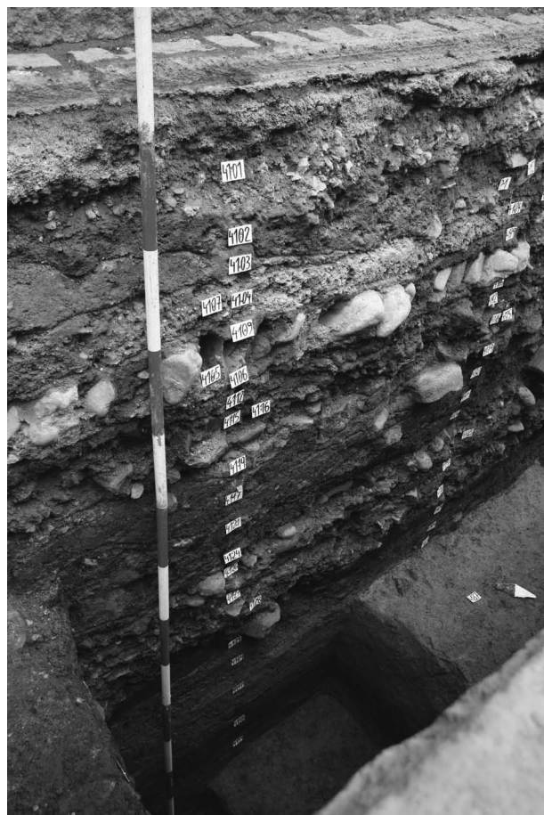
Obr. 89. Opava - Beethovenova ulice. Sonda S4. Celkový pohled na řez historickým nadložím s jednotlivými úrovněmi komunikačních povrchů ulice. Foto František Kolář.

Abb. 88. Opava, Beethovenova-Straße. Grabungsschnitt S1. Gesamtblick auf Untergeschoss des oberirdischen Pfosten-Holzerdebaues. Foto František Kolář.