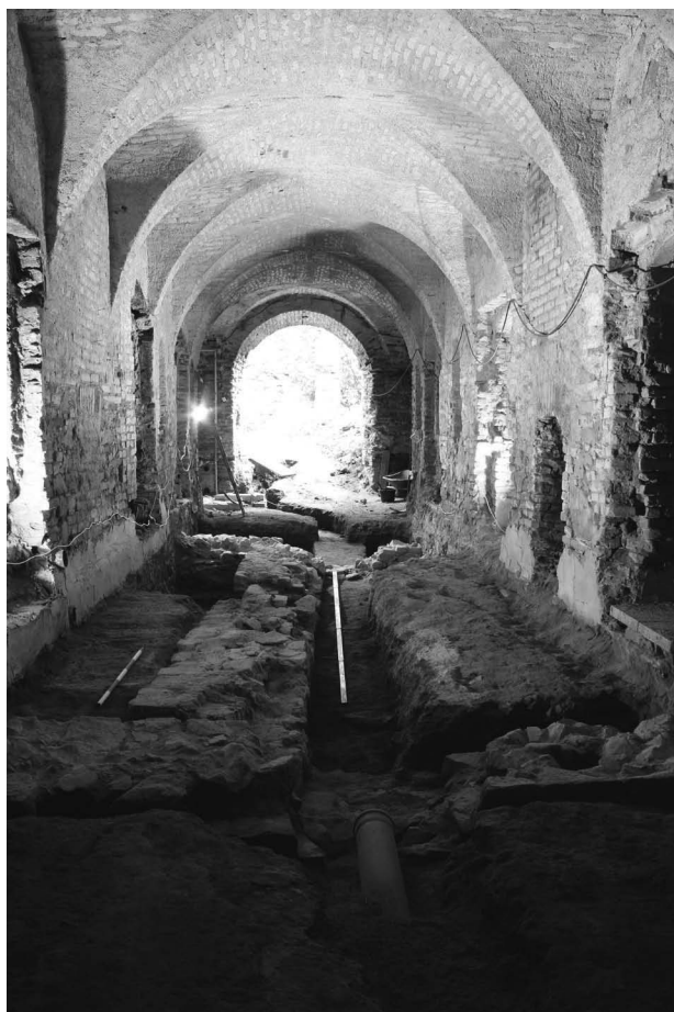
Obr. 44. Dolní Kounice, klášter Rosa Coeli. Celkový pohled od severu na archeologické situace odkryté v chodbě. Abb. 44. Dolní Kounice, Kloster Rosa Coeli. Gesamtüberblick aus nördlicher Richtung über die freigelegten archäologischen Fundplätze im Gang.