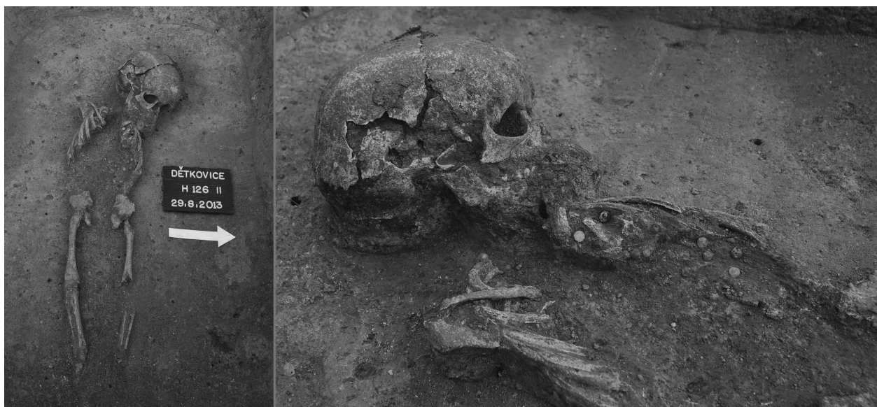
Obr. 41. Dětkovice, okr. Prostějov, „Za zahradama“. Hrob 126, skelet II a detail garnitury náhrdelníku vyrobeného z karneolu a křišťálu.