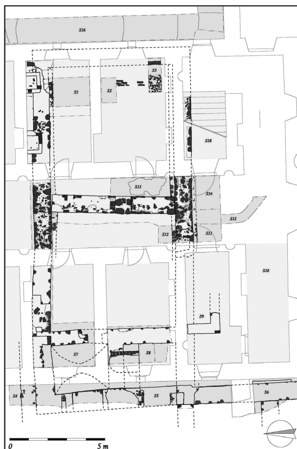
Obr. 43. Dolní Kounice, klášter Rosa Coeli. Poloha a čísla sond v rámci barokního konventu.

Pro romantický vzhled celého areálu a středověkou autenticitu byl klášter v hledáčku vlastivědců, uměno-