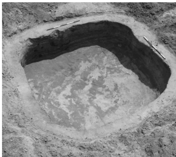
Obr. 8. Polešovice. Halštatská zemnice.

Fig. 8. Polešovice. A sunken hut from the Hallstatt period.