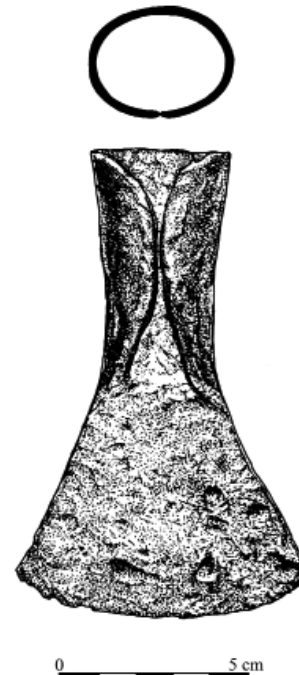
Obr. 5. Luděřov. Železná sekerka.

Luděřov (Bez. Olomouc). „Švédská hradba“, Latènezeit. Eisen Beil. Oberflächensammlung.