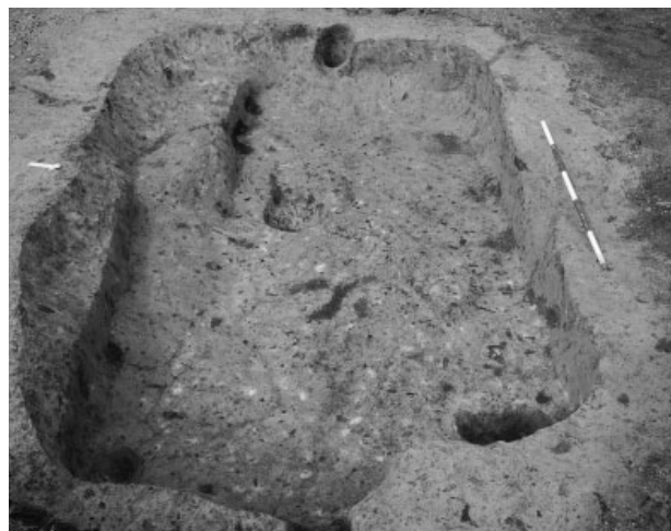
Obr. 1. Blažovice. Laténská zahloubená chata. Abb. 1. Blažovice. Latènezeitliches Grubenhaus.

Blažovice (Bez. Brno-venkov). Bei der Rettungsgrabung in der Flur „Pod kostelem“ wurde der weitere Teil der bekannten latènezeitlichen Siedlung entdeckt.