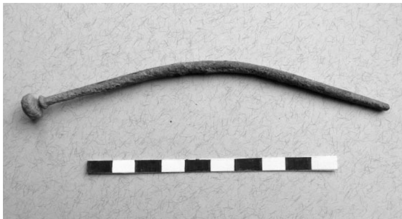
Obr. 23. Vítová. Bronzová jehlice s profilovanou hlavicí. Abb. 23. Vítová. Bronzenadel mit profilierem Kopf.