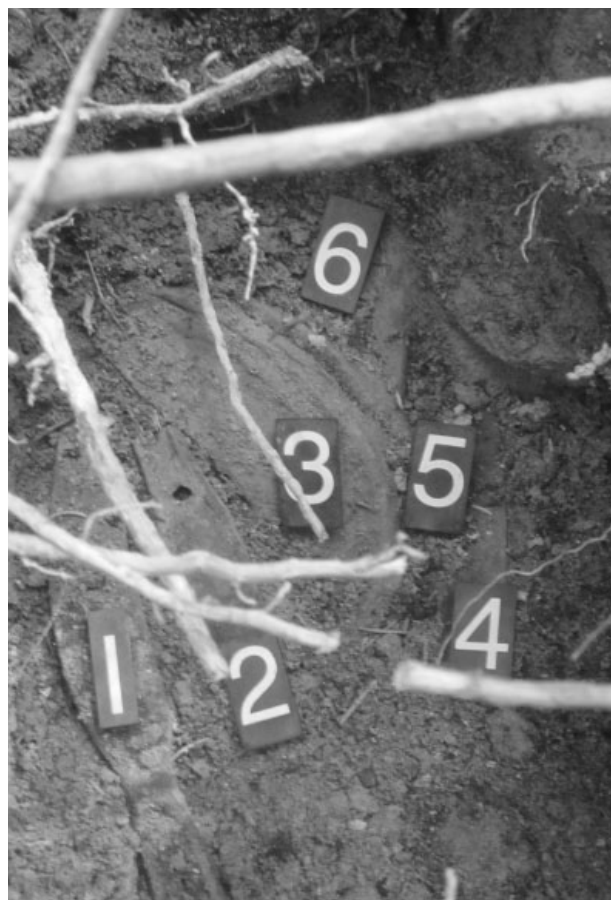
Obr. 21. Slatinky. Uložení depotu v jamce. Abb. 21. Slatinky. Depotfund in die Grube.

Slatinky (Bez. Prostějov). „Velký Kosíř“. Spätbronzezeit. Depotfund. Rettungsgrabung.