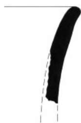
5. Inv. č. 42/12-108/2