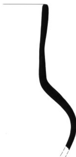
4. Inv. č. 42/12-108/1