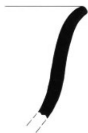
2. Inv. č. 42/12-237/19