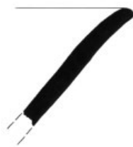
3. Inv. č. 42/12-237/24