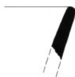
6. Inv. č. 42/12-108/3