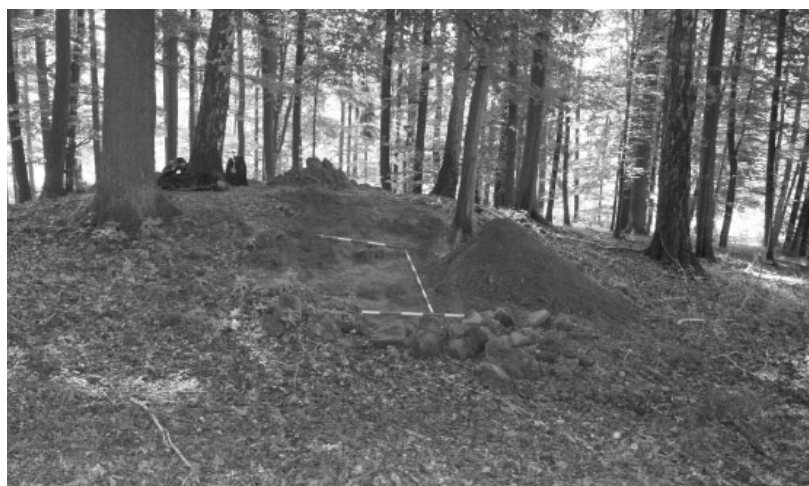
Obr. 14. Králová. Mohyla během výzkumu.